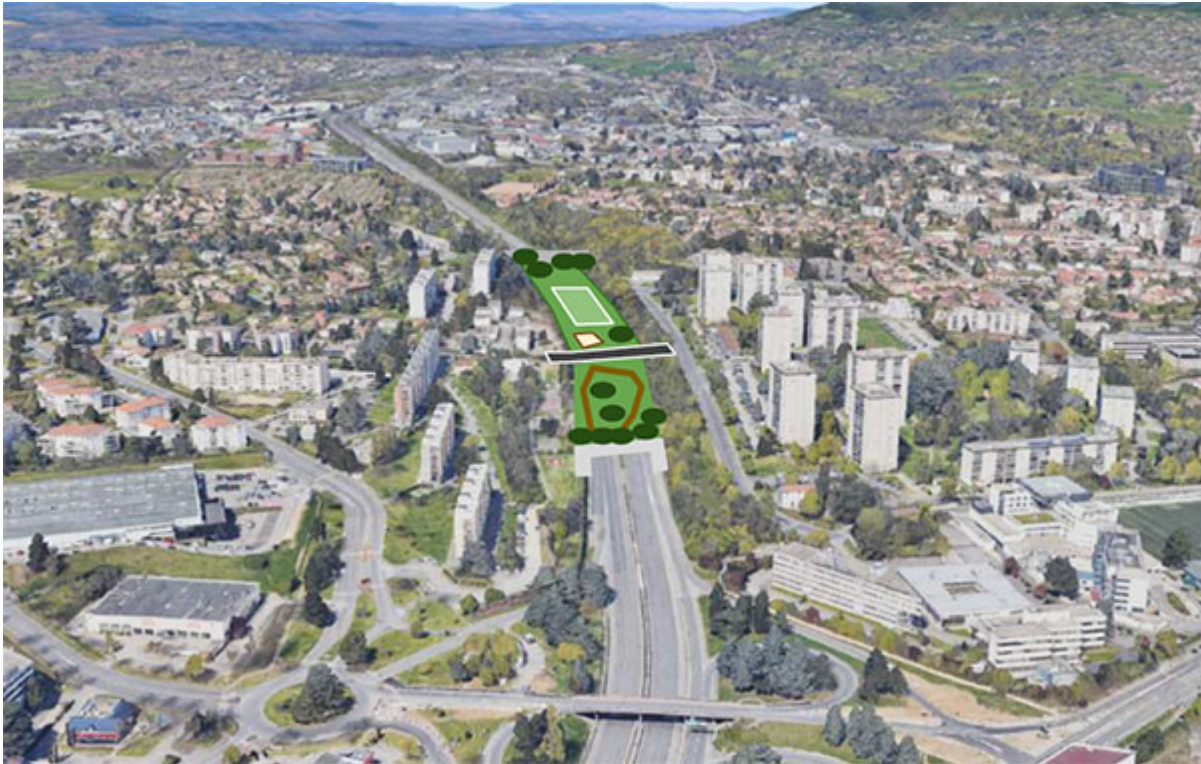
Zone d'emprise du projet sur la M6

Ecully souffre de la présence de la route métropolitaine M6, anciennement autoroute A6 car déclassée en 2016. Cette infrastructure scinde en effet la commune en deux parties Est et Ouest inégales, isolant particulièrement le quartier des Sources, et est à l'origine de fortes nuisances sonores. Le travail mené par Auguste PERSON, Cécile BALLY et Cyril LEFEBVRE a porté sur la faisabilité d'une couverture de la M6 et, grâce à une modélisation des émissions acoustiques , sur les impacts positifs au plan des nuisances sonores . Un chiffrage estimatif a été proposé.