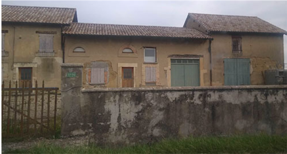
Construction en pisé, route de Pizay