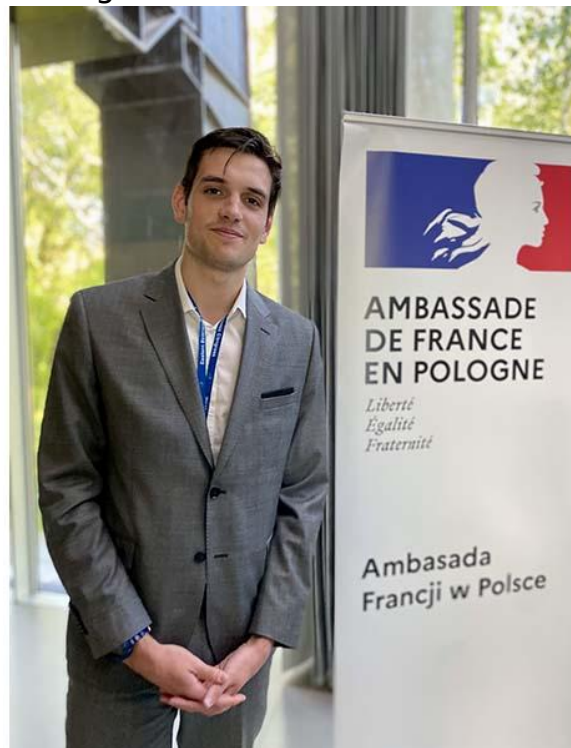
L o Billard - Ambassade de France, Varsovie, Pologne