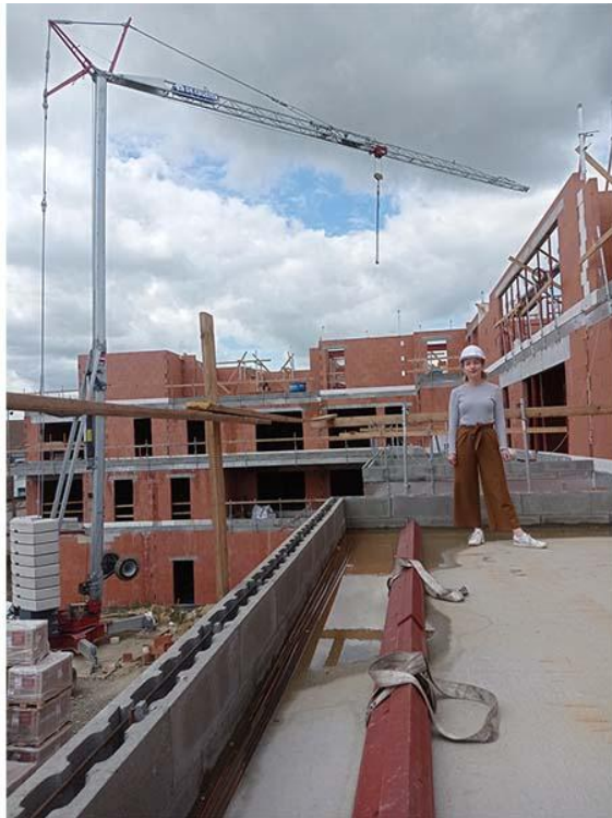
Nadège Penin - Thierry Thiébaud architectes & ingénieurs, Peruwelz, Belgique