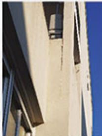
Xavier POTIER ENTPE - Université de Lyon

Entaille réalisée dans l'entrait de la charpente pour que le volet puisse s'ouvrir entièrement.