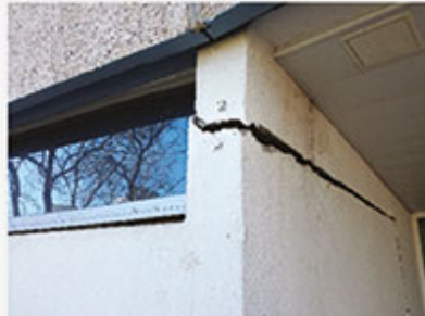
Théo DUSANG Deuxième Prix

Coulures de rouille en façade, sous-faces et bandeaux des balcons. Ancrages des gardes corps altérés.