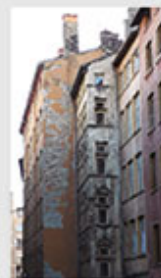
Aliona SAULNIER Équipe ENTPE

Université de Lyon Fissurations des murs d'une maison construite sur un sol argileux, suite à une mauvaise étude de sol.