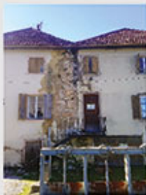
Allan PETIT ENSA Nancy

Académie de Strasbourg Raccordement de la chaudière au conduit d'évacuation avec un simple papier aluminium, l'ensemble étant tenu avec du fil de fer barbelé.