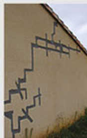
Enzo LEVY Équipe ENTPE

Lycée Heinrich-Nessel Académie de Strasbourg Cloquage du revêtement d'un mur suite à une infiltration d'eau sous le revêtement.