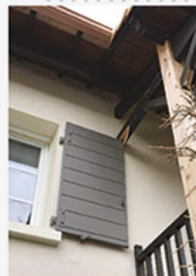
Antoine FORTINEAU Prix Spécial du Jury

Fissures importantes des murs du bâtiment dues à un tassement différentiel du terrain.