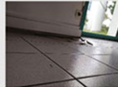
Louise Astrid STAMMLER

ENSTIB - Université de Lorraine Condensation très importante sur le plafond et les murs de cette salle de bains suite à un défaut de ventilation et d'isolation.