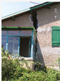
Alban LOISEAU ENTPE - Université de Lyon

Équipe ENTPE - Université de Lyon Soulèvement et casse du carrelage suite aux mouvements du sol ou du support.