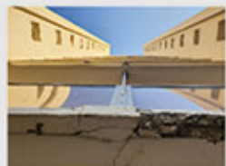
Alexis CORRE Équipe ENTPE - Université de Lyon

Défaut de jonction des toitures de deux maisons mitoyennes, entraînant une infiltration des eaux pluviales et une dégradation des enduits de façade.