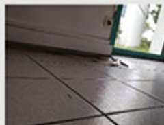
Louise Astrid STAMMLER Équipe ENTPE - Université de Lyon

ENSTIB - Université de Lorraine Condensation très importante sur le plafond et les murs de cette salle de bains suite à un défaut de ventilation et d'isolation.