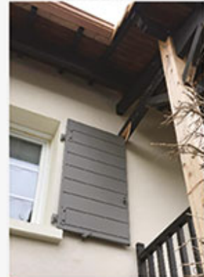
Antoine FORTINEAU Prix Spécial du Jury

Fissures importantes des murs du bâtiment dues à un tassement différentiel du terrain.